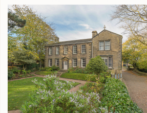
Brontë Parsonage Museum