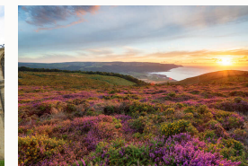
Le brughiere in fiore di Haworth.