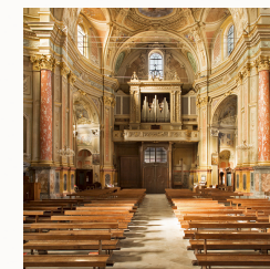
Chiesa di Giovanni Battista