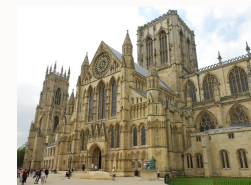
La Cattedrale di York.