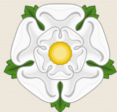
La rosa bianca degli York.

Ecco a voi un itinerario di viaggio ispirato ai luoghi in cui é ambientato il romanzo " Cime Tempestose " della durata di 3 giorni.